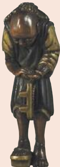
Il Geta (zoccolo) rotto, legno laccato e dorato, altezza mm 84 (fronte e profilo).