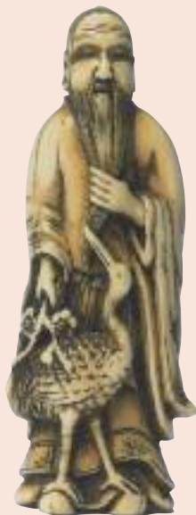
Saggio cinese. Lotto 362.