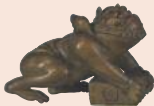
Oni cacciatore mancato, legno, firmato Minsbo, altezza mm 29.