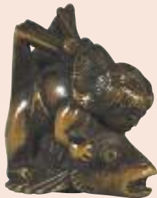
Kintari e la carpa, legno di cipresso (hinoki), occhi in pasta di vetro, non firmato, altezza mm 43.