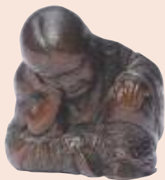
Shoji. Lotto 402.