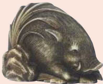
Cinghiale. Lotto 356.

Lotto n. 356, cinghiale, avorio, firmato Kai-gyokusai M a s a t s u g u ,