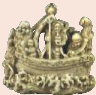
Takarabune con i Sette Dei della Fortuna, avorio marino, firmato Ryuchin, altezza mm 41 (fronte e particolare della firma).

Sarà pubblicato un catalogo scientifico comprendente alcuni agili saggi che illustreranno l'origine, la funzione d'uso, le varie tipologie e le scene raf-