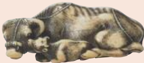
Bue con vitellino. Lotto 351.

Lotto 351, bue con piccolo, avorio, firmato Tomotada Kyoto, XVIII secolo, lungo mm 62, stimato 6.000/7.800, rimasto invenduto. Il netsuke è uno di quelli che tutti vorremmo nella nostra vetrinetta, sicuri di avere un pezzo di grande fascino e firma... Ed è proprio sulla firma che tutti si fanno nascere i dubbi, anche su questa apposta tra le zampe di questo pezzo presentato da Eskenazi Ltd. nel giugno del 1998!