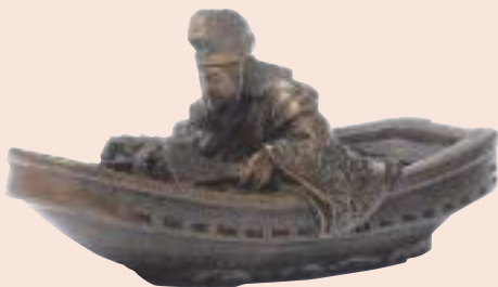
Figura su shirabyoshi. Lotto 410.