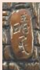
Karako che gioca con la maschera di Usobuki, noce naturale, firmato Seimin, alt. mm 37 (fronte e particolare firma).