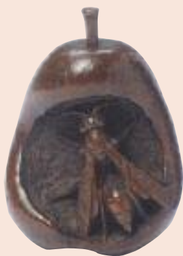
Pera con ape. Lotto 415.

E' un netsuke che tutte le collezioni dovrebbero avere,