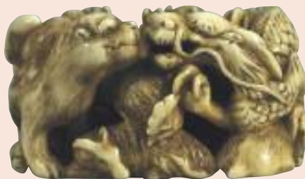
Gli animali dello zodiaco, avorio, corallo e corno, firmato Toyu, altezza mm 26.

* Le didascalie dei netsuke sono riprese da: GIACINTO U. LANFRANCHI, Il Netsuke, Bergamo, 1962.