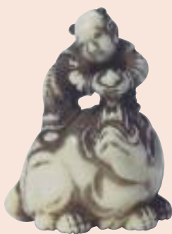
Boy che cavalca Baku. Lotto 349.

La casa d'aste londinese Bonhams, martedì 13 maggio scorso, all'interno del catalogo Fine Japanese Art ha inserito un gruppo di una novantina di netsuke di varie provenienze (leggi mercanti) che sono andati dispersi con risultati altalenanti, comunque tendenti al basso, colpa, a nostro parere, della scarsa qualità dell'insieme, tale da non attrarre l'attenzione dei collezionisti.