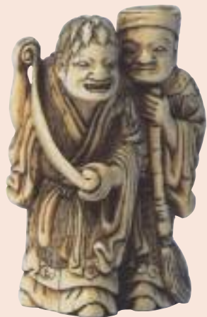
Kanzan e Jittoku. Lotto 362.

Lotto n. 365, figura di saggio cinese, avorio, non firmato, XVIII secolo, altezza mm 95, valutato 3.750/4.500 euro, venduto a 4.700 euro. Anche questo netsuke ci sembra stato sottovalutato dalla sala: le notevoli dimensioni, l'epoca,