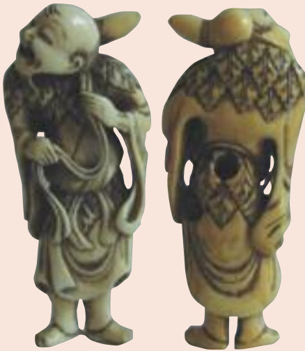
Fig.g 4, 4a

Quando Chokwaro viene rappresentato come l'Immortale cinese Chang-kwoh-lo il suo attributo identificativo è ridotto