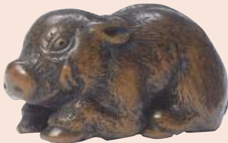
Cinghiale. Lotto 417.

Alla fine di un lungo articolo sulle porcellane tarde, un noto esperto inglese, così concludeva: "... quando c'è la qualità, la storia ... quella arriva, inesorabile, da sola".