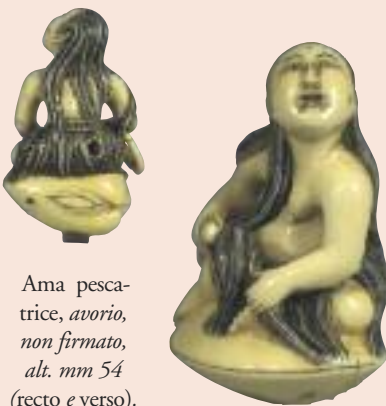
Ama pescatrice, avorio, non firmato, alt. mm 54 (recto e verso).

La galleria La Galliavola - Arte Orientale sarà fra gli sponsor tecnici della manifestazione, insieme ad AXA Art e Arterìa.