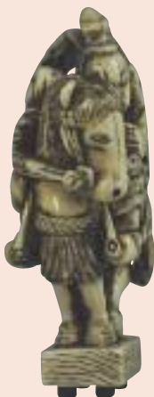
Oguri Hangan, avorio, non firmato, altezza mm 58 (fronte e profilo).