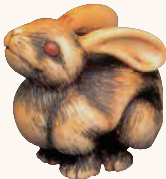
Fig. 4 - Collezione privata

patinate e dagli occhi intarsiati in ambra. Un nostro personale apprezzamento a questo netsuke , dello stesso autore di quello precedente, ma di una qualità nettamente superiore.