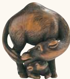
Lotto n. 66

Lotto n. 65. Netsuke in avorio, una quaglia su una pancocchia di granoturco, non firmato, inizi del secolo XIX, altezza mm 54, valutato 2.000/3.000 euro e aggiudicato a 1.800. Bellissima questa quaglietta dall'inusuale decoro del piumaggio a strisce, la cura dell'intarsio degli occhi, una patina affascinante. Nelle nostre ricerche abbiamo ritrovato questo netsuke , venduto dalla Christie's a Londra l'11 Maggio 1982, lotto numero 73, per 453 sterline. Anche in considerazione di questo, lo riteniamo un altro regalo natalizio.