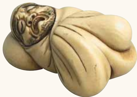
Fig. 1, 1a

Ed ecco quindi uno tra i miei artisti preferiti, Shukosai Anraku , che lavora dalla metà alla fine del XIX secolo, riprendere più volte e in forme differenti la rappresentazione del Daruma : la figura 1-1a, in via esemplificativa, mostra infatti il Patriarca Buddista, completamente avvolto nelle sue vesti, mentre dorme con la testa appoggiata sopra la tradizionale cesta per le elemosine. La bocca è aperta, come quando ci si abbandona ad un profondo sonno, e l'immagine globale che ne deriva è talmente vivida e intensa che ci sembra quasi di poterlo sentir russare... Alla figura 2 vediamo Daruma rabbiosamente accigliato, appoggiato contro un anello, mentre la frusta svolazza sopra il suo capo, quasi a voler spazzare via la "polvere" della vita terrena... un altro bell'esempio, dalla storia e dalla forma completamente differenti, di trasposizione in chiave umoristica di un concetto sicuramente molto profondo.