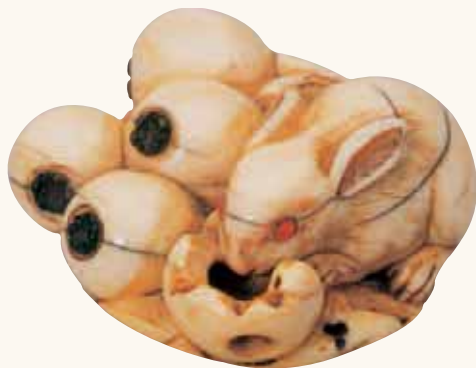
Fig. 10 - Collezione privata

Alla foto 12, una bella coppia di lepri in legno, firmata Kokei (1820 - 1830), pupillo di