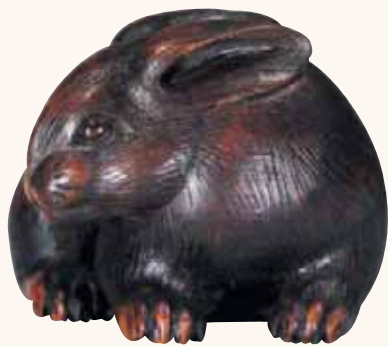
Fig. 1 - Collezione Bruno Asnaghi

Iniziamo con un coniglio in legno (foto n. 1), firmato Masanao , inizio XIX secolo, del quale possiamo apprezzare la straordinaria raffinatezza dell'incisione del pelo, che conferma la firma del grande maestro di Yamada. Una coppia di conigli in avorio (foto n. 2), inizio XIX secolo,