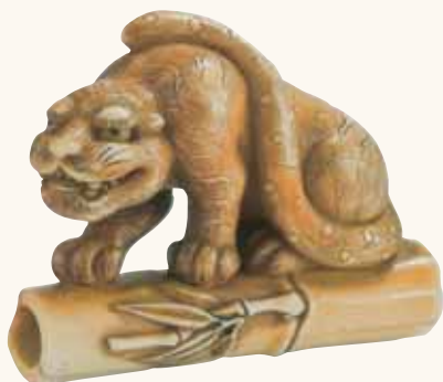
Lotto n. 50

neppure raggiunta dalle offerte: invenduto. Inspiegabile il rifiuto dei collezionisti per un pezzo simile. Molto probabilmente è dovuto alla firma, non creduta, forse anche in ragione di una dimensione relativamente piccola del netsuke , non usuale per i soggetti di Okatori .