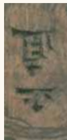
Part. lotto n. 53

Altrettanto d'impatto, come il precedente al lotto 41, ma non altrettanto fortunato, questo cinghiale di bella ed elegante fattura ha il solo neo della firma Masanao : correttamente la casa d'aste lo dichiara secolo XIX/XX, facendo