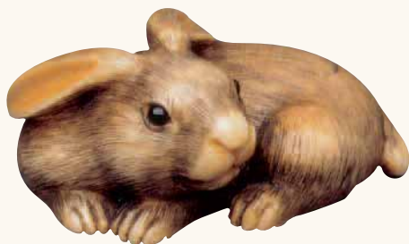
Fig. 3 - Collezione privata

avorio, occhi intarsiati in corno, non firmata ma probabilmente attribuibile alla Scuola di Kyoto, prima metà del XIX secolo: un pezzo affascinante ed espressivo, caratterizzato dalla pelliccia finemente incisa e tinta.