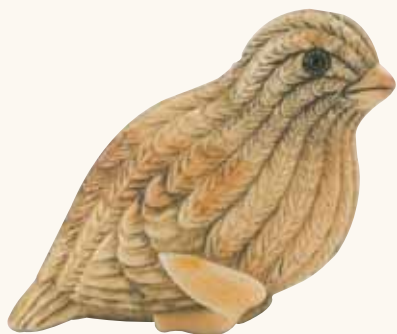
Lotto n. 65