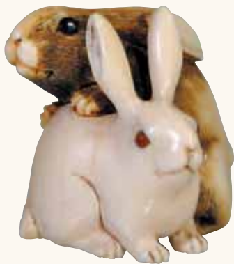
Fig. 2 - Collezione Bruno Asnaghi