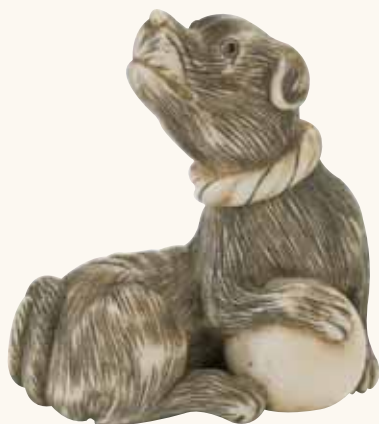
Lotto n. 84

Lotto n. 84. Netsuke in avorio, cane con palla, non firmato, inizi del secolo XIX, altezza mm 43, stimato 3.000/4.000 euro, viene aggiudicato a 3.000. È un soggetto molto ricorrente e piacevole, a volte segnato anche da firme importanti come Tomotada .