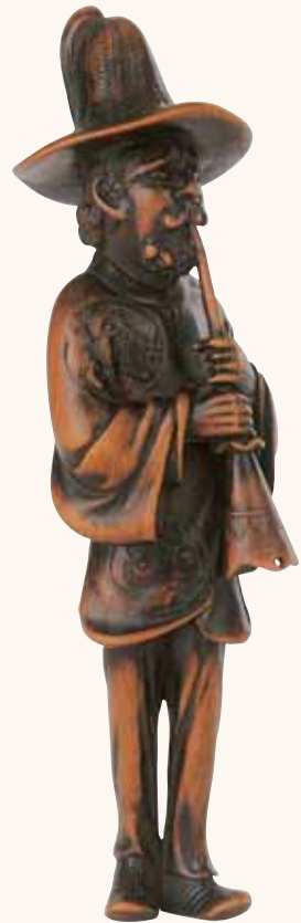
Lotto n. 14

Lotto n. 14 " Important netsuke " in legno di bella patina. Uno straniero che soffia dentro un tromba tenuta a due mani. Vestito con un abito cinese, porta sul capo un cappello che evoca un fiore di loto rovesciato. Non firmato, primi del secolo XIX. Alto cm 15,5. Stimato 2.000/2.500 euro e aggiudicato a 20.401 euro. La dimensione assolutamente eccezionale e il soggetto sinceramente inusuale, non giustificano, a nostro avviso, il trattamento simile al Tomotada : stessa valutazione, stessa aggiudicazione. Il musicante straniero è stato pagato leggermente troppo e forse il bufalo avrebbe meritato un apprezzamento superiore. Se il compratore fosse lo stesso farà sicuramente una media e si troverà comunque soddisfatto. Complimenti!