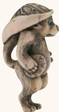
Lotto n. 73

Lotto n. 66. Netsuke in legno, un dromedario con piccolo, firmato Masatoshi , secolo XX, alto mm 41, con una stima di 6.000/8.000 euro, invenduto. Questo netsuke del grande Masatoshi , primo nome Nakamura Tokisada , scomparso nel 2001 e considerato uno dei master contemporanei, ottiene solo un'offerta a 4.500 euro e non viene aggiudicato.