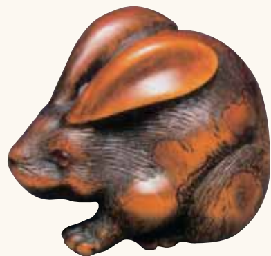
Fig. 5 - Collezione privata

Lepre accovacciata in legno di bosso tinto, (foto n. 5), firmata Toyomasa , Scuola di Tamba, fine del XVIII secolo, caratterizzata dalle lunghe orecchie