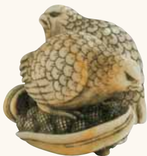
Lotto n. 45

drago in una forma quadrata con gli himotoshi naturali al centro e tralasciando la caratteristica sinuosità tipica del dragone. Il prezzo pagato rispecchia in effetti la stima media di un buon manju .