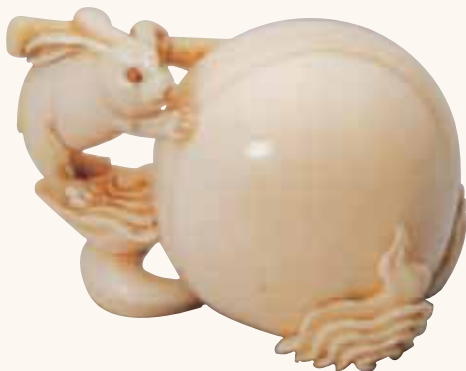
Fig. 11 - Collezione privata