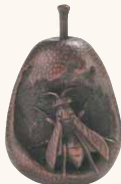
Lotto n. 56

Il problema nasce probabilmente nell'attribuzione del periodo (metà XIX secolo), quando, da recenti studi, pare sia accertato che Kogetsu sarebbe nato nel 1851 e vissuto almeno fino a 77 anni (data incisa su un suo pezzo). Si desu-