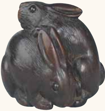
Fig. 12 - Collezione Bandini