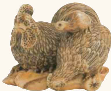
Lotto n. 40

Lotto n. 38 Netsuke in avorio, animale fantastico, non firmato, fine secolo XVIII-inizio XIX, altezza mm 39, stimato 4.500/6.500 euro e aggiudicato a 5.000. Più che fantastico, curioso: appare come una tigre seduta su di un tronco di bambù, la coda rassomiglia a quella fiammeggiante