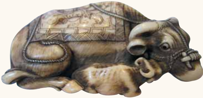
Lotto n. 10

Lotto n. 10. "Beau netsuke" (?) in avorio. Un bufalo con accanto il piccolo che gli lecca il muso, il dorso dell'animale ricoperto da un tessuto finemente decorato. Una corda serrata attorno alla testa e alle narici, lasciata poi liberamente posata sul dorso. Occhi