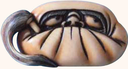
Fig. 3, 3a