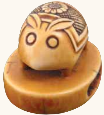
Fig. 13 - Collezione Bandini

Minko , da cui il carver eredita la peculiarità di intarsiare gli occhi degli animali in corno, come avviene anche in questo caso.