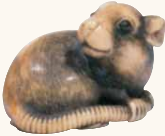
Lotto n. 11

incrostatati in corno. Lungo cm 6,5. Firmato Tomotada , fine del periodo Edo. Valutazione 2.000/2.500 euro. Aggiudicato, ma a questo punto non c'era da dubitarne, a 20.401 euro. Quasi sicuramente un lavoro del grande artista di Kyoto , evidentemente riconosciuto all'interno di una piazza attenta come quella parigina, basti pensare alla dimensione inconsueta, al particolare della corda e a quello assolutamente raro della coperta di tessuto arabescato sul dorso. Un eccezionale netsuke ! Ringraziamo l'amico Jean-Yves