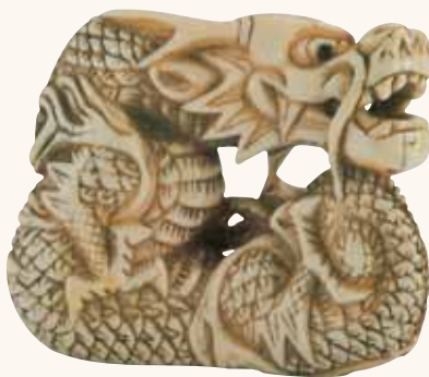
Lotto n. 44

Lotto n. 44. Netsuke in avorio, dragone, non firmato, fine secolo XVIII-inizio XIX, altezza mm 55, parte con una stima di 2.500/3.500 euro e conferma la stima di base 2.500 euro. Il soggetto del drago è abbastanza ricercato, quello che può aver frenato i collezionisti è la tipologia del netsuke , molto vicina al manju , venendo così a comprimere il