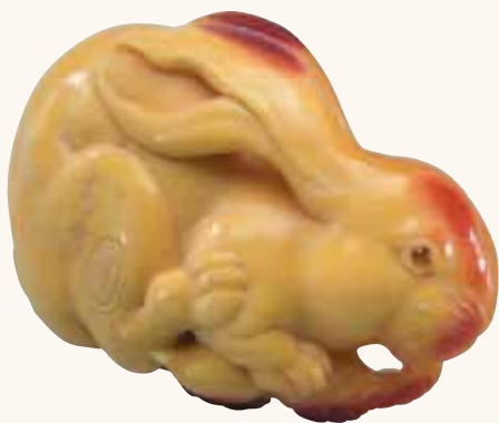
Fig. 7 - The Lub Collection