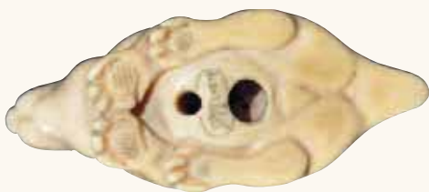
Fig. 9, 9a - Collezione Walcher

È del carver Yoshinaga , uno dei maestri della Scuola di Kyoto, citato dal Gonse come pseudonimo di "Homme des Iles", il leprotto in bell'avorio a patina gialla, seduto, con sguardo attento, sulle zampe posteriori (foto n. 9, 9a).