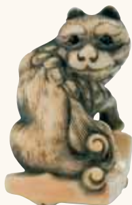
Lotto n. 38

La casa d'aste Nagel di Stoccarda, lo scorso 4 novembre, ha messo in vendita 121 netsuke appartenenti ad un collezionista tedesco. La dispersione della propria collezione, sperando che il non menzionato collezionista sia in vita, dovrebbe essere un momento di orgoglio e di gratificazione personale ed economica, il che non guasta.