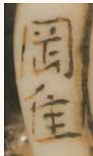
Part. lotto n. 45

Lotto n. 45. Netsuke in avorio, due quaglie su una spiga di miglio, firmato Okatori , secolo XVIII/XIX, alto mm 34, una stima prudenziale di 2.000/3.000 euro che non viene