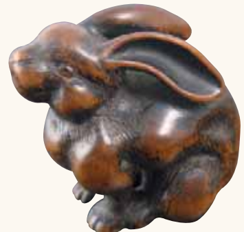
Fig. 15 - Collezione Bandini