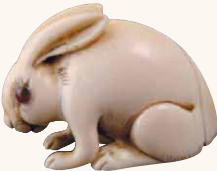
Fig. 14 - Collezione Bandini

Infine, alla foto 15, ancora un soggetto accovacciato sulla zampe posteriori, con il musetto rivolto alla luna. È un netsuke in legno di bosso, firmato Toyomasa , Scuola di Tamba, circa 1800, che ricorda l'esemplare alla foto 4: somiglianza che viene a rafforzarsi dal momento che entrambe le lepri sono opera dello stesso carver .