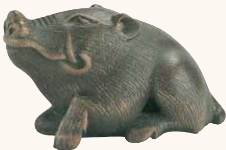
Lotto n. 53

Lotto n. 53. Netsuke in legno, un cinghiale, firmato Masanao , secolo XIX/XX, altezza mm 55, valutato 2.000/3.000 euro, non ha trovato compratori.