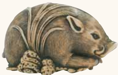
Lotto n. 41

natezza del piumaggio, la compattezza del netsuke e la sua calda patina sono da ammirare. Il fortunato acquirente probabilmente ha stentato a credere ad un regalo simile prima di Natale!