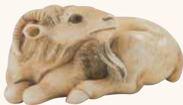
Lotto n. 81

Lotto n. 81. Netsuke in avorio, un caprone accovacciato, non firmato, inizi del secolo XIX, lungo mm 47, valutato 4.000/6.000 euro, conferma la base d'asta di 4.000 euro. Un superbo netsuke , uscito dalle scuole o dalle mani degli stessi maestri della fine del '700. La bellezza della testa, l'espressione degli occhi e la cura con la quale sono state scolpite le corna, confermano la qualità del pezzo.