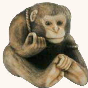
Lotto n. 64

Lotto n. 64. Netsuke in avorio, una scimmia con una corda, firmato Masatami , secolo XIX, alto mm 39, con una stima di 3.000/4.000 euro, è stato