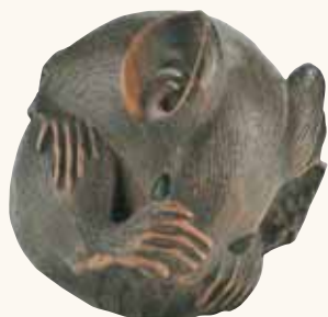
Lotto n. 63