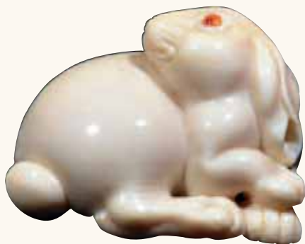
Fig. 8 - Collezione Pietropoli