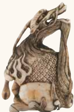
Lotto n. 46

neppure raggiunta dalle offerte: invenduto. Inspiegabile il rifiuto dei collezionisti per un pezzo simile. Molto probabilmente è dovuto alla firma, non creduta, forse anche in ragione di una dimensione relativamente piccola del netsuke , non usuale per i soggetti di Okatori .